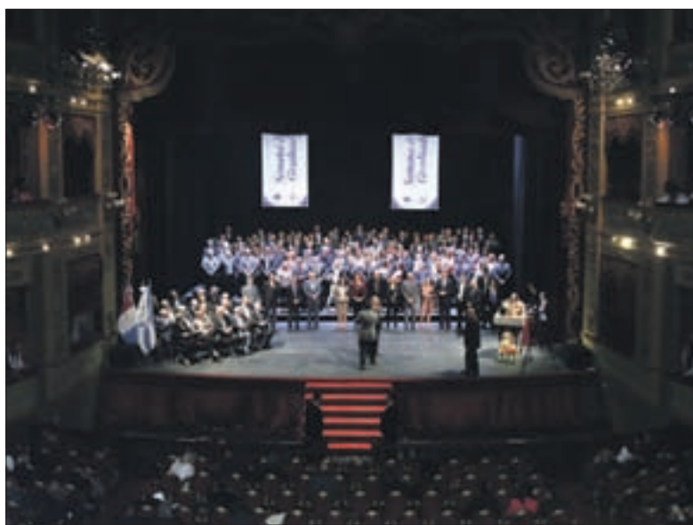
Las luces del majestuoso teatro, resaltaron los gestos de emoción de todos los que subían al escenario en busca de su galardón.