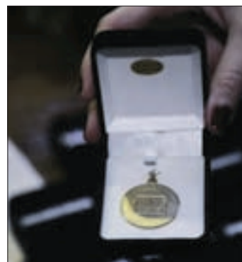
La distinción que se entregó a los matriculados homenajeados.